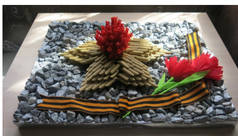
Работа Гевель Снежаны