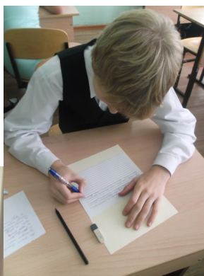
Все в творческой работе