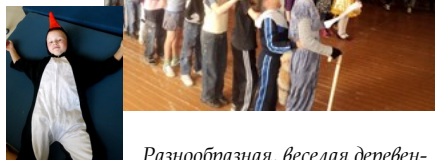
Разнообразная, веселая деревенская жизнь