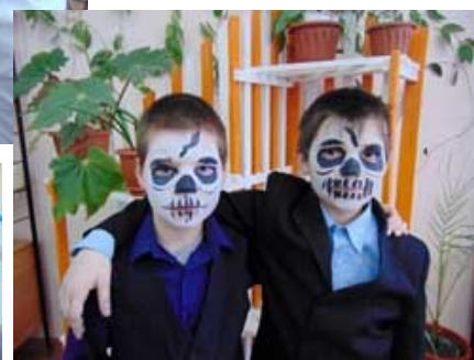
Будущие парикмахеры и визажисты

Мероприятия профориентационной направленности очень важны для ребят на данной стадии обучения. Именно сейчас они как бы в игровой форме могут окунуться в сферу различных профессий и испытать свои силы в той или иной деятельности. И когда подойдет пора определяться с выбором профессии в будущем, им будет гораздо легче, ведь они многое попробовали, узнали особенности различных профессий и даже сами что-то сотворили своими руками.