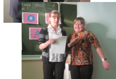
Что в имени тебе моем?