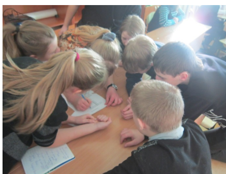
«Кто быстрее, умней и лучше»