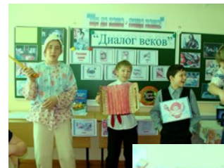
С песней веселей