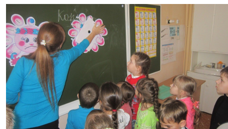
Помоги солнышку улыбнуться

Ребята вспомнили еще раз правила поведения за столом, а потом отправились в столовую, и в этот день уже точно вели себя правильно и вежливо. Желали друг другу приятного аппетита, а пообедав никто не забыл сказать очень важное слово «СПАСИБО». И повара, и сами ребята были довольны.