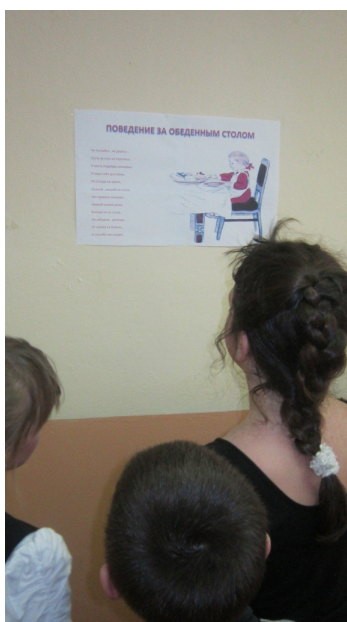
Умей вести себя за столом

Ребята вспомнили еще раз правила поведения за столом, а потом отправились в столовую, и в этот день уже точно вели себя правильно и вежливо. Желали друг другу приятного аппетита, а пообедав никто не забыл сказать очень важное слово «СПАСИБО». И повара, и сами ребята были довольны.